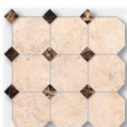
Mosaico Octagon Big LM 01, EL 03 30x30 (12x12")