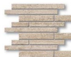
Jazz Muretto JZ 01 - JZ 02 - JZ 03 - JZ 04 30x35 (12x14")