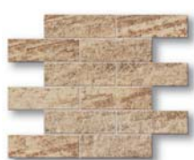
*Quarzite Bricks 38x30 (15x12")

*производится для всех артикулов и типов поверхностей/available in all colors and surfaces