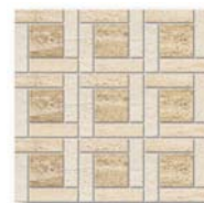
Jazz Paniere JZ 01, JZ 02, JZ 04 30x30 (12x12")