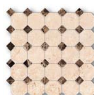
Mosaico Octagon Small LM 01, EL 03 30x30 (12x12")