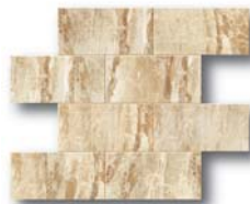
* Glatcher Bricks Big 28,6x35 (11,2x14")