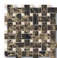
Limestone Intreccio EL 03, LM 01 33x33 (13x13")