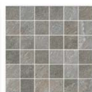
*Mixstone Mosaico 5x5 (2x2") 30x30 (12x12")