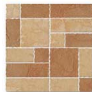
Antica Bozio AN 01, AN 02 30x30 (12x12")