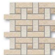
Jazz Borromini JZ 01, JZ 02, JZ 04 30x30 (12x12")