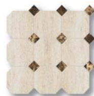
Jazz Octagon Big JZ 02, EL 03 30x30 (12x12")