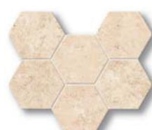
Limestone Hexagon 25x28,5 (9,8x11,2")