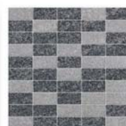
Energy Mosaico NG 01, NG 03 3x5 (1,2x2") 30x30 (12x12")