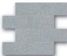
* Bluestone Bricks Big 28,6x35 (11,2x14")