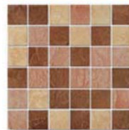
Antica Mosaico AN 01, AN 03, AN 04 5x5 (2x2") 30x30 (12x12")