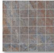
Rust Mosaico RS 01 5x5 (2x2") 30x30 (12x12")