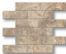
Pietra Bricks 38x30 (15x12")