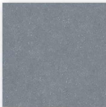
BS 01 nat