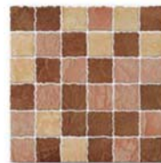
Antica Mosaico состаренная/distressed AN 01, AN 03, AN 04 5x5 (2x2") 30x30 (12x12")