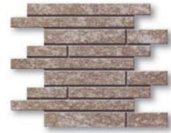
*Strong Muretto 35x30 (14x12")