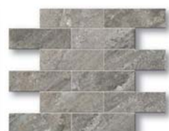
*Mixstone Bricks 38x30 (15x12")