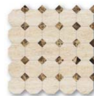
Jazz Octagon Small JZ 02, EL 03 30x30 (12x12")