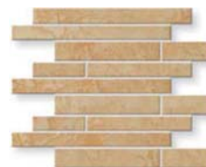
Antica Muretto AN 01 Antica Muretto AN 03 38x30 (15x12")