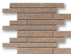
*Energy Muretto 35x30 (14x12")