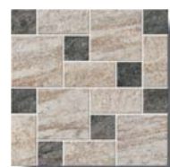
Quarzite Mosaico Zig Zag QZ 00, QZ 03 30x30 (12x12")