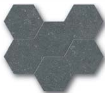
*Bluestone Hexagon 25x28,5 (9,8x11,2")