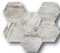
*Glatcher Hexagon 25x28,5 (9,8x11,2")