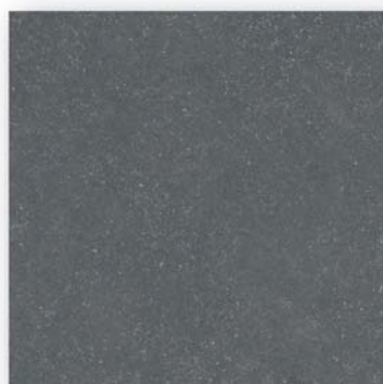
BS 02 nat